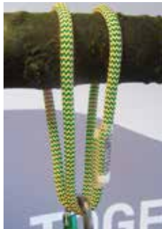
fig 2) as double loop