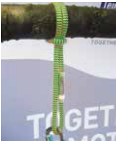
fig. 3) as constriction loop

The loops are wrapped around a climbing rope in a Prusik hitch. They are used to position a person. The enlacement must be performed correctly to retain the required clamping effect and breaking force. Breaking force at production acc. to EN 566: 22 kN Hitches in the rope may considerably reduce the breaking force.