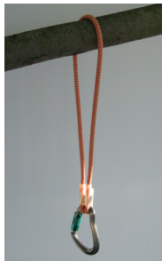
Abb. 1) Doppelstrang Keine Verwendung als Einzelstrang!

Diese Anschlagleinrichtung kann im Doppelstrang verwendet werden: