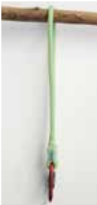
pic.1) Double strand

This anchor device can be used in double strand configuration: