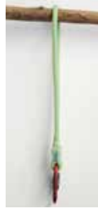
Abb. 1) Doppelstrang

Diese Anschlagrichtung kann im Doppelstrang verwendet werden: