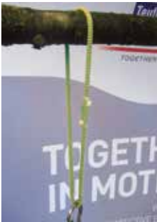
fig 1) as single loop

This anchor device may be used in three different ways: