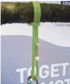
fig. 3) as constriction loop